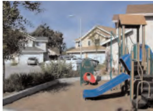
Programa de Compra y Reventa Vecindario de Laguna Grande

En el periódico The Monterey County Herald se publican muchos anuncios de talleres en la sección de bienes y raíces.